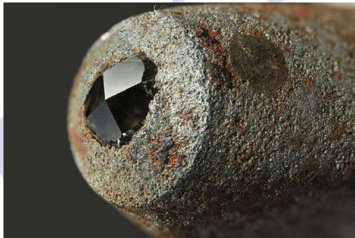
تصویر ۵) ایندنتور ویکرز با رأس هرمی شکل از جنس الماس

از سختی سنج ویکرز اصولاً در پژوهش‌ها استفاده می‌شود. یکی از مزایای سختی سنج ویکرز که بعضی از کاربران این دستگاه به آن اعتراف کرده‌اند، دقت اندازه‌گیری ابعاد فرو رفتگی حاصله است. اندازه‌گیری قطر یک مربع، بسیار دقیق‌تر از اندازه‌گیری قطر یک دایره است زیرا برای اندازه‌گیری قطر دایره بایستی فاصله دو خط مماس بر دایره اندازه‌گرفته شود. روش ویکرز، نسبتاً سریع بوده و با آن می‌توان سختی نمونه‌های نازک تا ۰,۰۰۶ اینچ ضخامت را اندازه‌گرفت. به نظر می‌رسد که امکان مسطح شدن ایندنتور ویکرز کمتر از ایندنتور برینل باشد. از معایب آزمایش ویکرز این است که این آزمایش، مخرب بوده و سرعت اجرای آن کمتر از آزمایش برینل و راکول است و سطح قطعه نمونه را بایستی قبل از آزمایش پرداخت نمود که این کار وقت زیادی را می‌گیرد. اگرچه آزمایش ویکرز بسیار دقیق‌تر از راکول و برینل است ولی قیمت دستگاه آن نیز گرانتر می‌باشد. در مقابل، نتایج آزمایش ویکرز در سطح وسیعی از صنایع پذیرفته شده است.